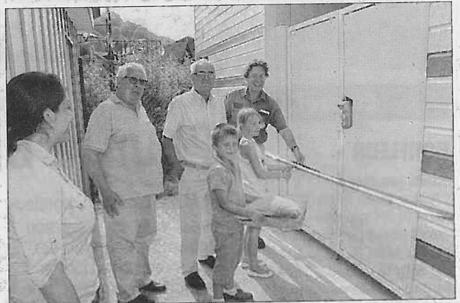
Élus et membres du CNH ont inauguré le nouveau bloc sanitaire financé par la Ville.

Au printemps dernier, le CNH, sur ses fonds propres et grâce à une subvention de